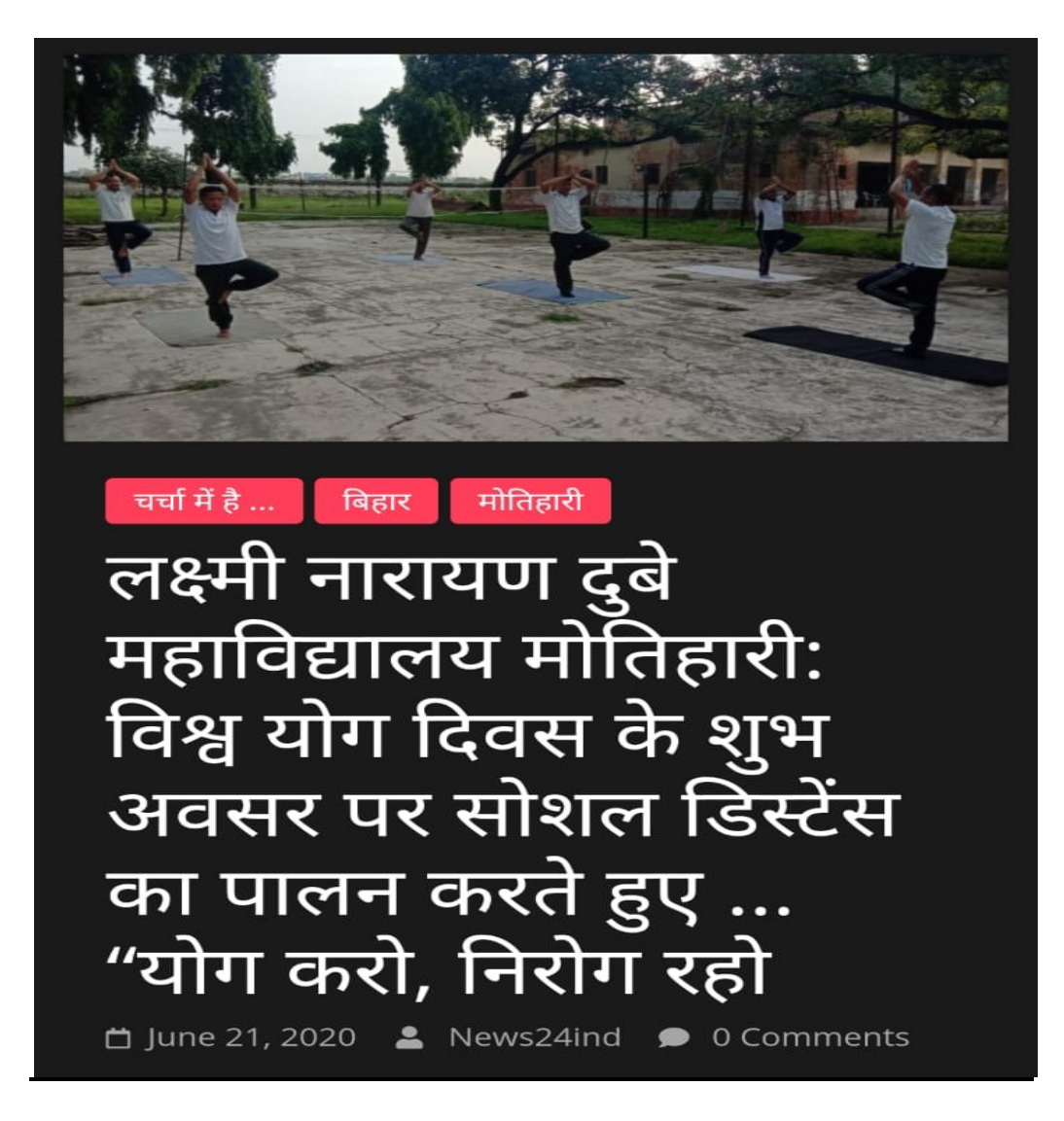
Yoga Day Celebration